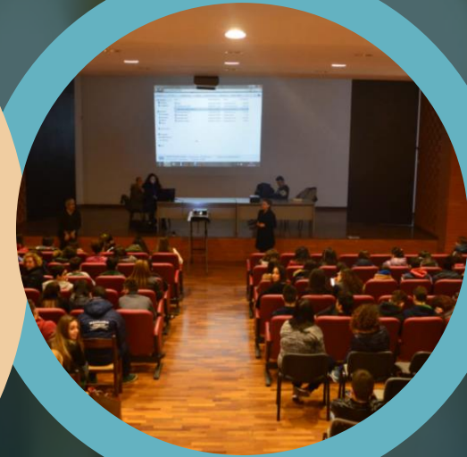
La nostra Aula Magna