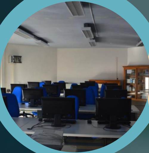
La nostra aula informatica