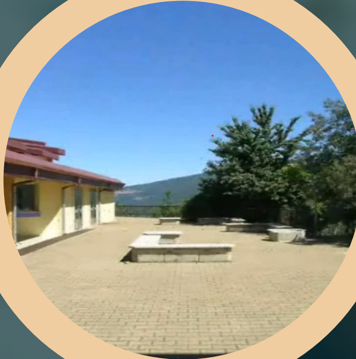
Il nostro Istituto